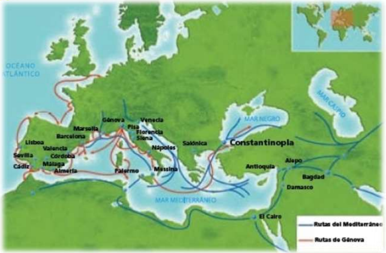
Mapa de las rutas comerciales europeas en el siglo XV