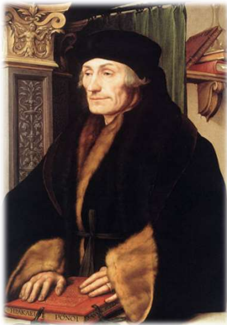
Retrato de Erasmo de Rotterdam por Hans Holbein el Joven

Por otra parte, la increíblemente difundida popularidad de sus obras, traducidas del latín a las lenguas vernáculas y escritas en un lenguaje simple y directo, puso los más complejos problemas religiosos al alcance de todos los lectores, universalizando y haciendo accesibles numerosas cuestiones que hasta ese momento habían sido exclusivas de una pequeña élite intelectual eclesiástica.