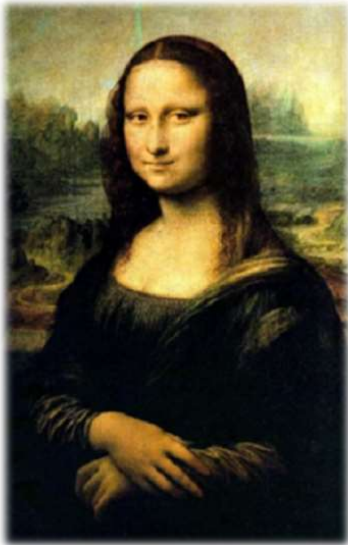
Oleo “La Gioconda” de Leonardo Da Vinci, pintado entre 1503 y 1519

De esta propagación del Humanismo hay que destacar dos figuras que, no siendo italianas, son los máximos representantes del movimiento . Antes de abordarlos hay que tener en cuenta que el Humanismo Italiano siempre se ha visto como más “paganizante” y no tan preocupado por cuestiones religiosas, es por ello que al Humanismo que surge en el norte de Europa se le ha atribuido un carácter mucho más religioso. Este movimiento renacentista coincidió con un momento de necesidad de reforma de la Iglesia, lo que caracterizará ampliamente este Humanismo. El modelo humanista del Norte es Desiderio Erasmo (1469-1536), conocido como Erasmo de Rotterdam por su lugar de nacimiento (Holanda).